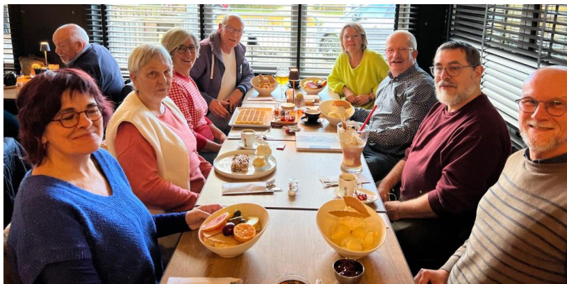
Tijd voor een vieruurtje, voor ieder wat wils...

De avond sloten we nog af met een gezellig culinair "rondetafelgesprek", met invloeden uit het verre oosten. Wil je weten wat dit betekent, dan raden we je aan volgende keer mee te gaan wandelen!